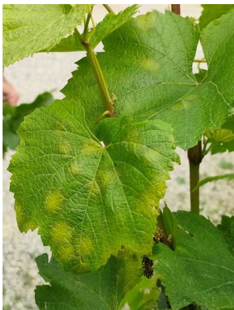
1 – Peronospora secondaria