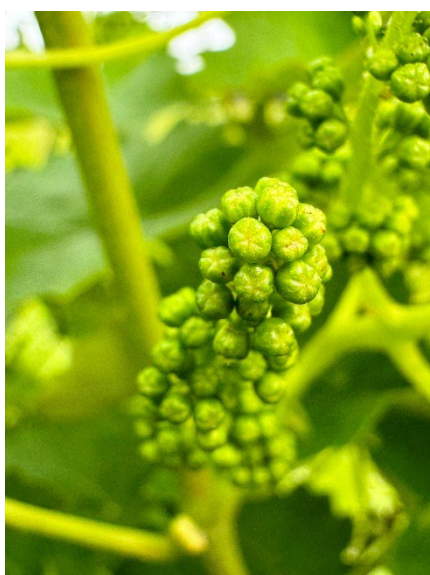
8 – Bottoni fiorali chiusi (glera)