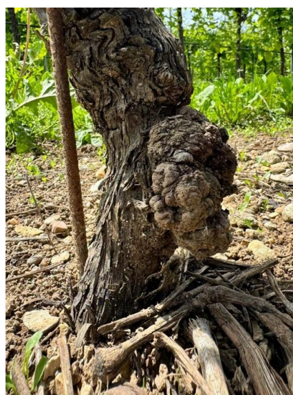
10 - Agrobatterio