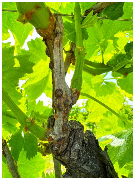
2- Cocciniglia del corniolo