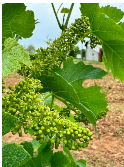
9 – Inizio fioritura (chardonnay)