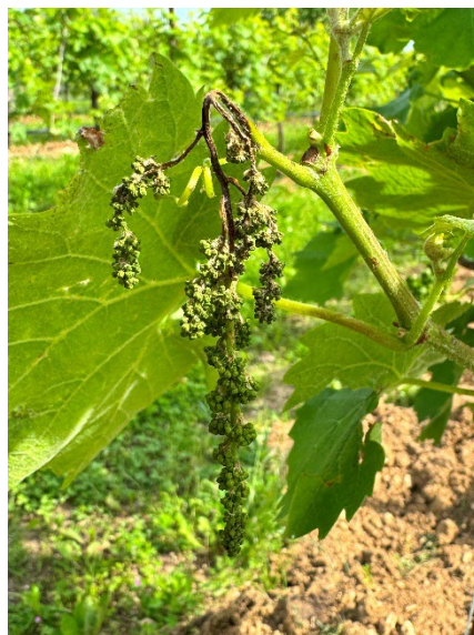
7 – Grappolo con botrite