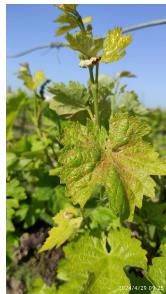
3- Danni da freddo (scottatura)