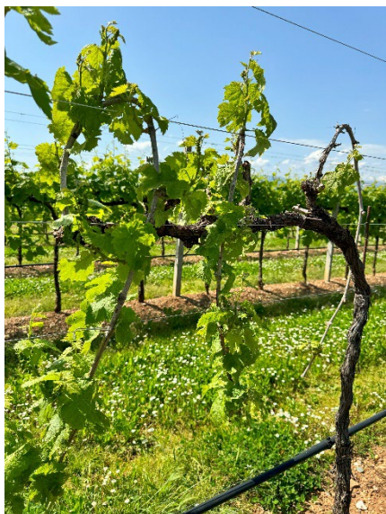
4 – Sintomi evidenti di giallume